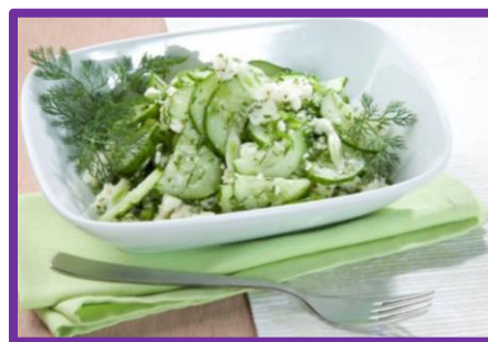
Огуречный салат с адыгейским сыром