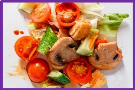
Салат с адыгейским сыром