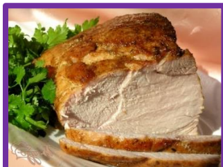
Запечёная свинина с адыгейской