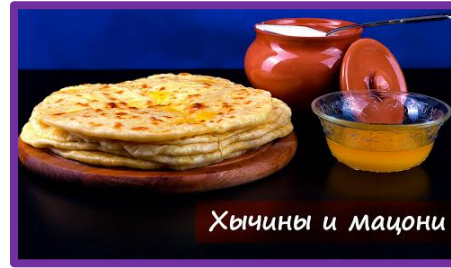
Хычины и мацони