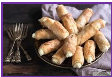
Слоёное печенье с адыгейским сыром

- А теперь представьте, что вы пришли в столовую или кафе, где много блюд адыгейской кухни. Очень много блюд с адыгейским сыром, о котором мы подробно говорили, когда знакомились с промыслами и ремёслами адыгейского народа. Некоторые из этих блюд на фотографиях нашей презентации. Я несколько раз назову эти блюда, потом закрою слайд, а вы постараетесь назвать их. Победит тот, кто больше запомнит и назовёт. Начали!