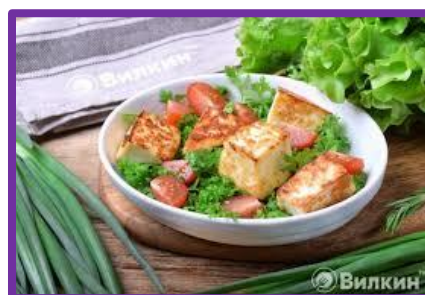
Жареный адыгейский сыр