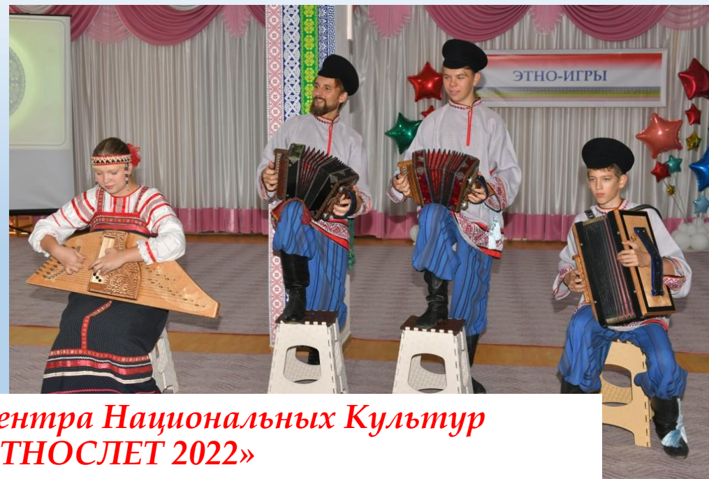
Выступление коллективов Центра Национальных Культур на семинаре «ЭТНОСЛЕТ 2022»