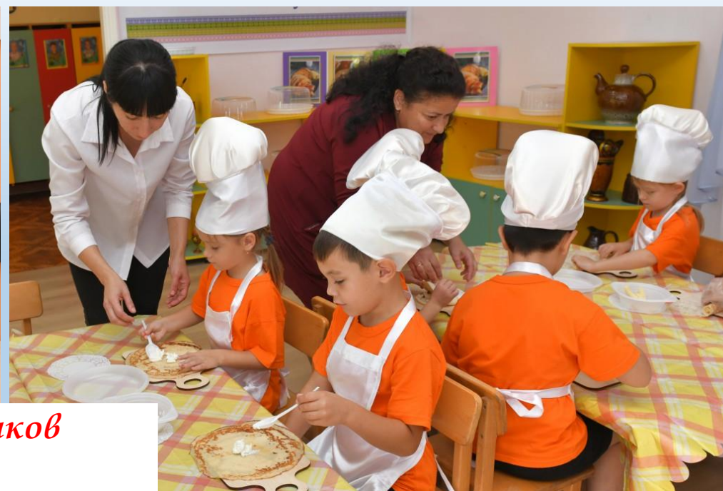
Муниципальный слет команд дошкольников «ЭТНОСЛЕТ 2022»