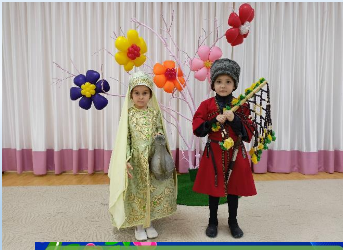
Постановка «Цветущее дерево дружбы»