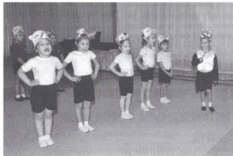
Фото 6. Исполнение песни-инсценировки

Воля птичке дорожке золотой ... (клетки) .