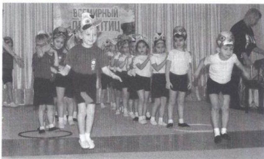
Фото 3. Эстафета «Скок-скок на зеленый лужок»