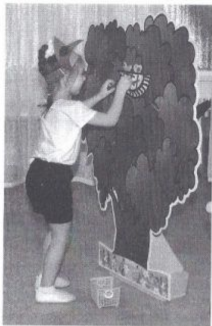
Фото 4. Эстафета «Построй гнездо для птичек»

Инструктор. Давайте проверим. А поможет нам в этом эстафета.