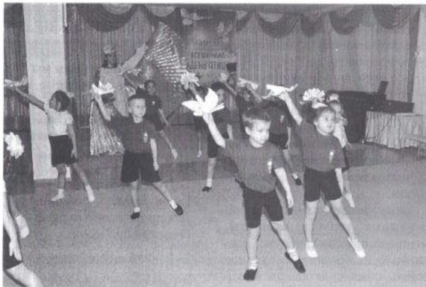
Фото 1. Танец с бумажными голубями