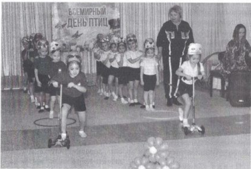
Фото 2. Эстафета «Чьи птицы самые быстрые?»

птицы самые быстрые?» (фото 2). Участники по одному на самокатах объезжают «дерево», возвращаются обратно и передают самокат следующему игроку. Побеждает команда, быстрее закончившая эстафету.