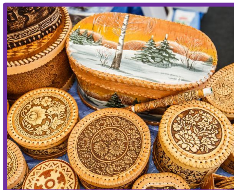
Резьба по дереву