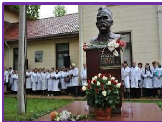
Памятник С. Ю.Соколову

- Люди разных национальностей живут в нашем городе мирно и создают такую красоту всему миру на радость!