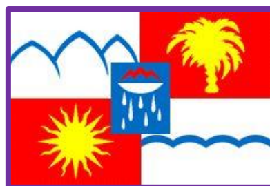
Флаг города-курорта Сочи

- На гербе и флаге изображены пять символов курорта Сочи. Вверху изображены горы, символизирующие Красную Поляну, и золотая пальма. Внизу море и восходящее солнце, как символ развивающегося курорта. В центре герба находится изображение чаши с пламенем, из которой падают огненные капли. Это символ целебного источника Мацеста , в переводе с убыхского языка - «мацеста», означает «огненная вода».