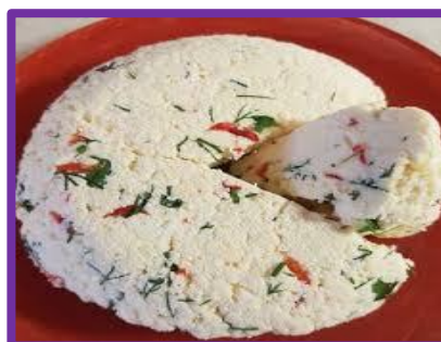
Адыгейский сыр с укропом