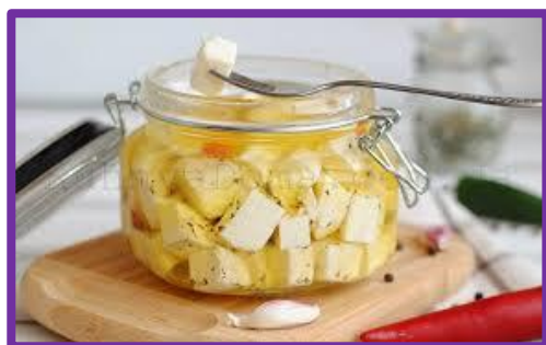
Адыгейский сыр маринованный