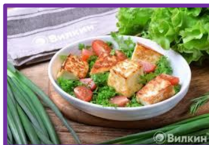
Жареный адыгейский сыр