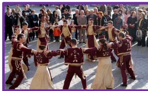
Армянский танец свободы и воли

Армянский национальный танец «Кочари» По сигналу солиста двенадцать молодых людей начинают «храбрый танец». Так переводится название танца кочари. Так предки поддерживали свой боевой дух перед сражениями. И этим же танцем праздновали победу. Кочари танцевали даже у стен Рейхстага в мае 1945 года. Сто лет назад это был только мужской танец. Теперь им увлекаются и женщины, и дети. Это танец, в котором очень много пружинистых движений. Нужно запомнить такт: два шага вправо и два влево, а самое главное – выпады вперед и назад. В школах преподают национальные танцы и песни. Дети с большим интересом учатся и выступают на праздниках. Напомним, что танец Кочари включён в список нематериального культурного наследия ЮНЕСКО, а в 2014 году был включен и армянский традиционный хлеб лаваш .