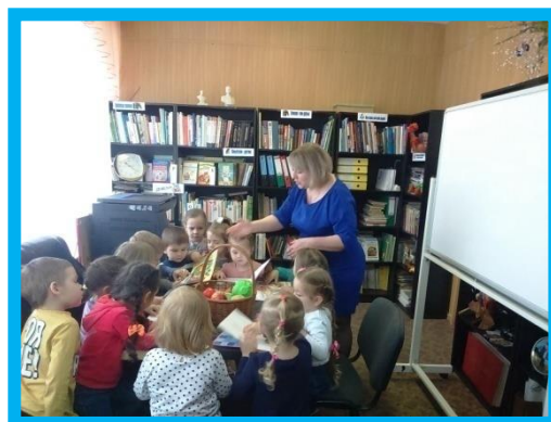
Ищем информацию в библиотеке