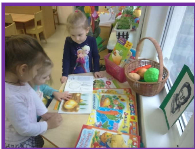
Разглядываем иллюстрации об овощах