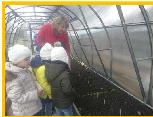
Посетили теплицу нашего садика