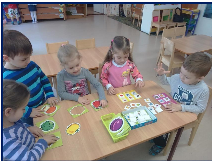
Сюжетно-ролевые, настольные игры про овощные культуры