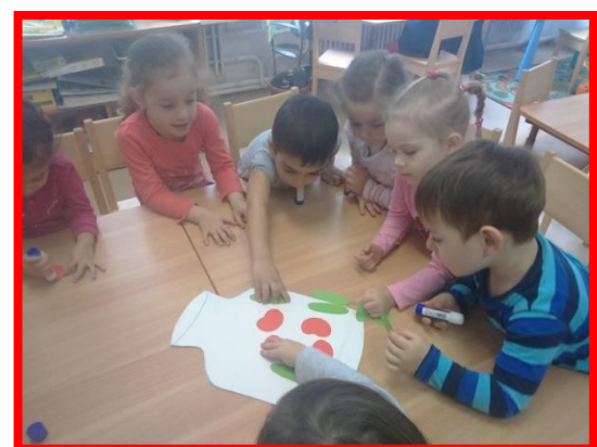
Аппликация из овощных культур