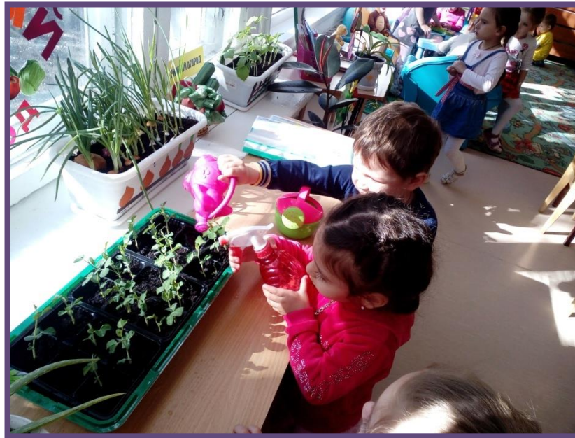
Наш огород на подоконнике набирает силу!