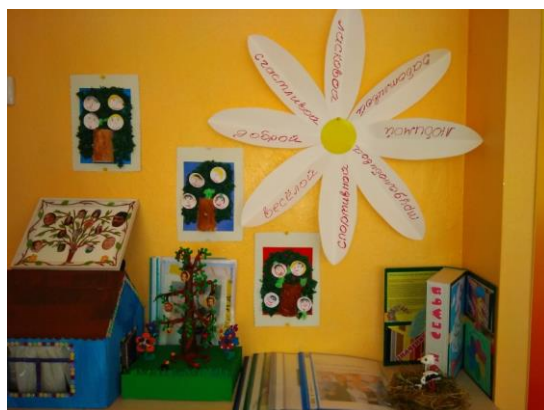
Мини музей «Семейные ценности»

С большим объемом проделанной работы и собранным материалом был создан мини музей в группе «Семейные ценности», куда вошли совместные работы детей и родителей.