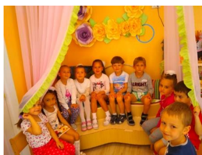
Беседа о семье

Беседуя с детьми о семейных праздниках, рассказала им о символе семьи, которым является ромашка, и ребята предложили сделать свою ромашку в группе, а на каждом лепестке написать обозначения какая должна быть семья.