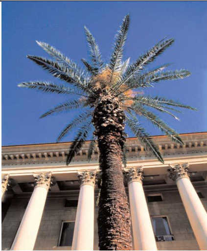
Финиковые пальмы являются экзотическим украшением города