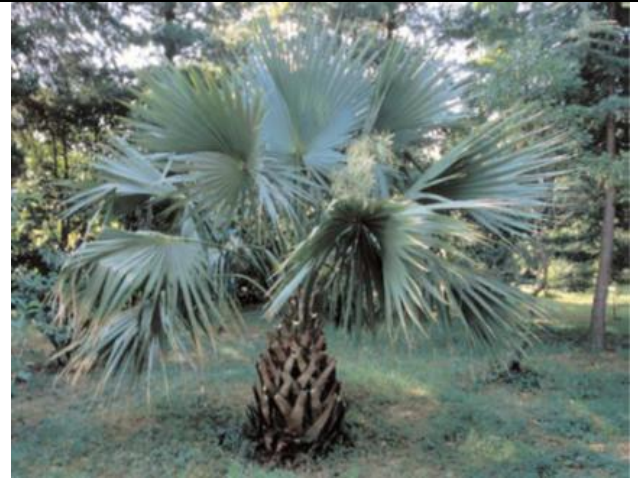
Медленнорастущий сабаль притеняющий взрослым стать не спешит