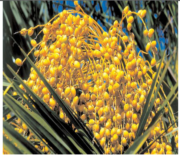
Обильный урожай несъедобных плодов даёт пальма финика канарского