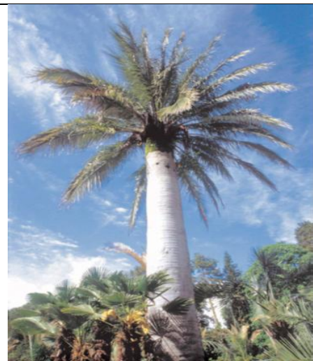
Взрослые экземпляры юбеи чилийской украшают пальмарий сочинского Дендрария