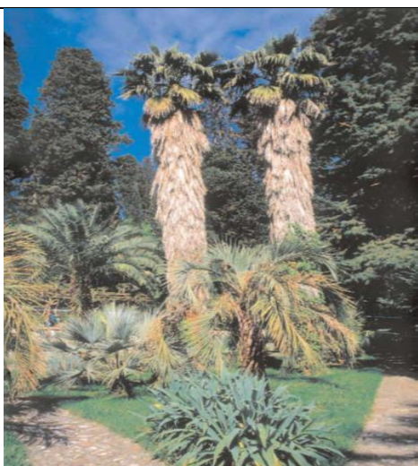
Вашингтония мощная принялась в юбки из засохших листьев, пышные кроны пальм вашингтоний украшают наш город

В начале работы дети знакомились с разновидностями пальм нашего поселка через фотографии в книгах, журналах, проспектах, путеводителях. На земле растет более 210 родов и 2780 видов пальм. Мы живем в субтропиках, поэтому в нашем городе представлены разные виды пальм: