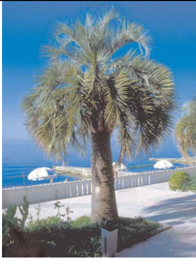
Красивы своими перистыми полукружьями перистые листья бутии головчатой