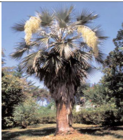
Эритея вооруженная, «голубая пальма», - гостя из знойной Аризоны