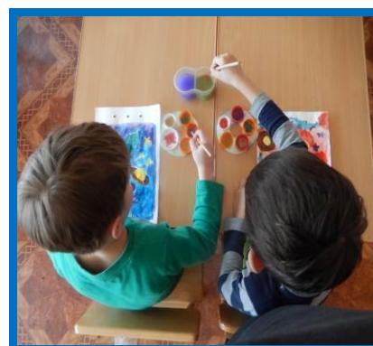
Фото 3 Палитра для рисования