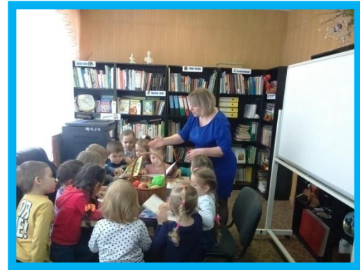
Ищем информацию в библиотеке