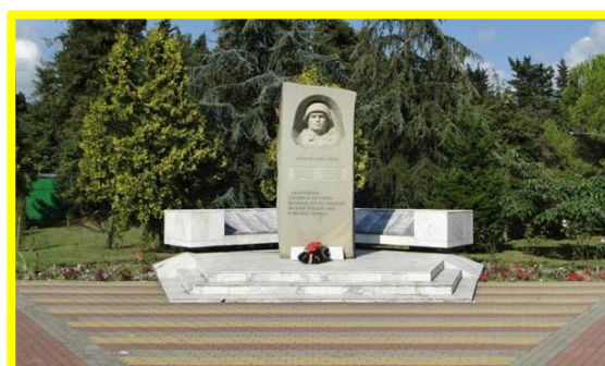
Памятник героям-лазаревцам и жертвам Великой Отечественной войны на территории парка культуры и отдыха имени 30-летия Великой Победы

После экскурсии ребята возложили цветы к памятнику отважному летчику, Герою Советского Союза Дмитрию Леонтьевичу Каларашу , имя которого носит СОШ № 80. Минутой молчания почтили память всех, кто не вернулся с поля боя, защищая родное Отечество от врага.