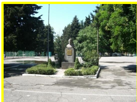
Памятник Каларашу Д.Л. около СОШ № 80

После экскурсии ребята возложили цветы к памятнику отважному летчику, Герою Советского Союза Дмитрию Леонтьевичу Каларашу , имя которого носит СОШ № 80. Минутой молчания почтили память всех, кто не вернулся с поля боя, защищая родное Отечество от врага.