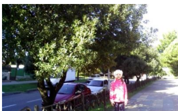
Каменные дубы около моего сада

Я удивилась, что в мире несколько сотен видов дубов. В лесах Краснодарского края 5 видов. Конечно, в городских парках и скверах видов дуба гораздо больше. Так в парке «Дендрарий» около 80 видов. Но их завезли из других краёв. А в дикой природе на Черноморском побережье в основном встречается скальный, черешчатый и грузинские дубы. Мы обследовали окрестности нашего посёлка и дубы, растущие в самом Лазаревском. В скверах мы встретили вечнозелёные пробковый и каменные дубы. В лесу и на улицах видели грузинские дубы. На улице Партизанской, где наш детский сад, аллея молодых каменных дубов , листья их имеют продолговатую форму без зубчиков по краям. Жёлуди на дубочках не очень горькие на вкус.